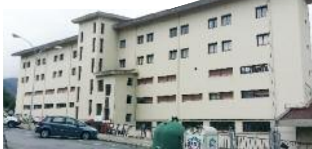
Larrañan irekiko dute errefuxiatuentzako aterpetxea

Eusko Jaurlaritzak dauka azpiegitura hori Larrañan, eta proposatu zigunean