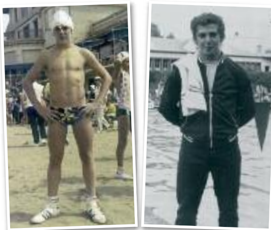
Igerilari garaiko oroitzapen onak ditu Artzak.