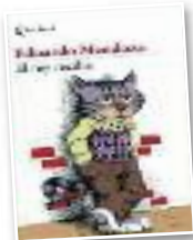
Literatura "El rey recibe"