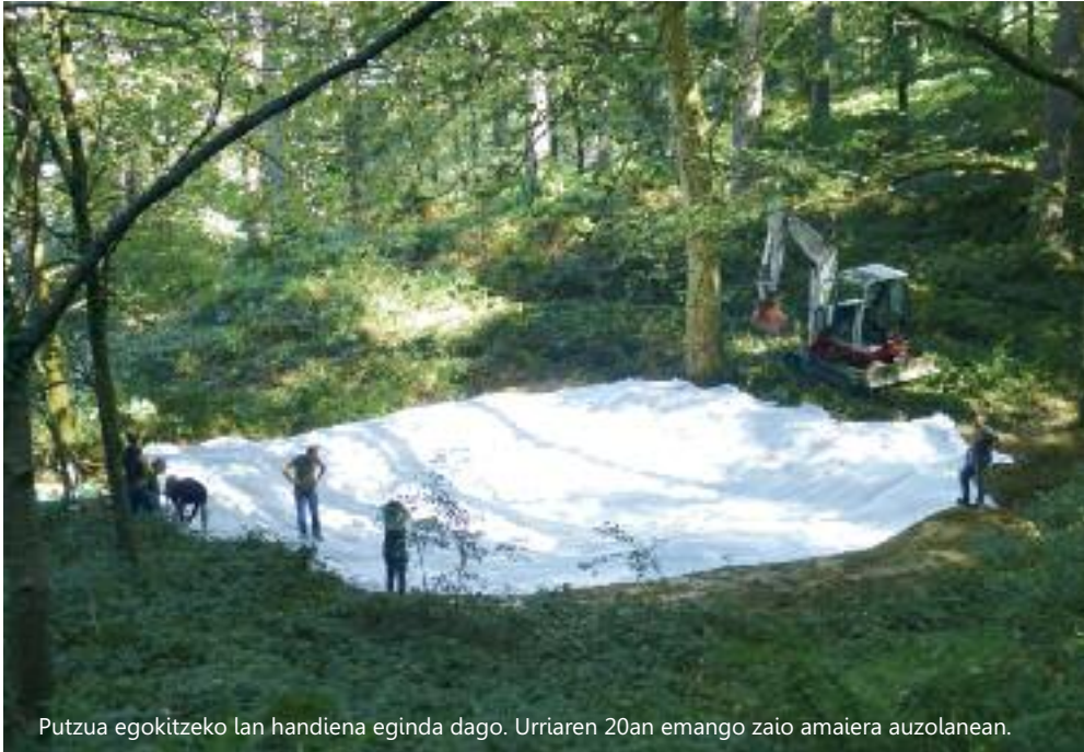
Putzua egokitze lan handiena eginda dago. Urriaren 20an emango zaio amaiera auzolanean.