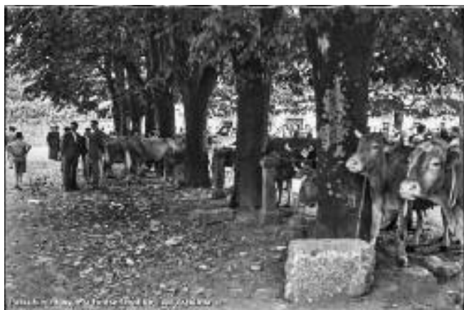
Idi-probetarako harria eta ganadua lotzeko zutabeak.

Egia esan, baserrietako bizimodua eta ekonomia aldatu ahal, feria-giroa ere zeharo apaldu eta ia desagertu egin da Oñatin eta beste herri gehienetan. Ganaduak aspalditxo ezkutatuziren Santa Marinatik ; urte batzuetan labrantzarako tresnak eta makinak hartu zuten haien lekua; mintegietako landareak ere ekarri ohi zituzten puska batean bizkaitarrek; baina azkenaldian oso noizbehinka heltzen dira hona lehenengo egubakoitzetan . Sasoi bateko testigu gisa, idi-probetarako harriak geratu zaizkigu Santa Marinan . Eta horiek ere, behe aldean, Gernikako arbolaren aldamenean, urte-mordoxka bat igaro eta gero bueltatu dira euren jatorrizko lekura, auzotar batzuen ahaleginei esker.