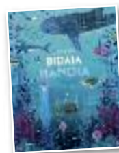
Haur liburua "Urpeko bidaia handia"