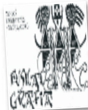
Euskal liburua "Euskal grafia"