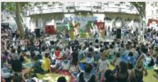
Gasteizko jaietan eskainitako saioaren irudia