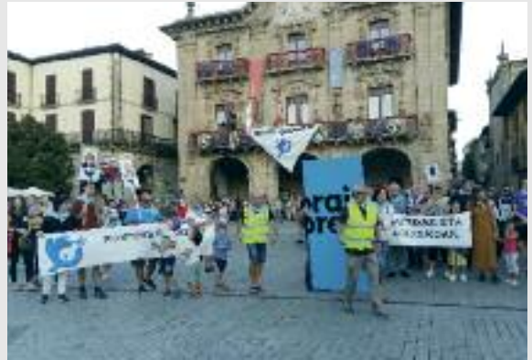
Presoen eskubideak aldarrikatzeko irailaren 29an Oñatin egin zen ekitaldiko irudia

'Orain presoak' lelopean, espetxe politika aldatzeko garaia dela aldarrikitzeko manifestazioa egingo da urriaren 20an, hain zuzen ere ETAK jarduera armatuaren amaiera iragarri zuela zazpi urte beteko diren egunean. Presoen urrunketarekin amaitzea, gradu progresioa ahalbidetzea, zigorren batuketarekin amaitzea eta gaixotasun larriak dituzten presoek neurri humanitarioak aplikatzea eskatuko da. Oñatiko Sare plataformak dei egiten die herritarrei mobilizazioan parte hartzera.