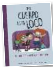
Haur komikia "Mi cuerpo está loco"