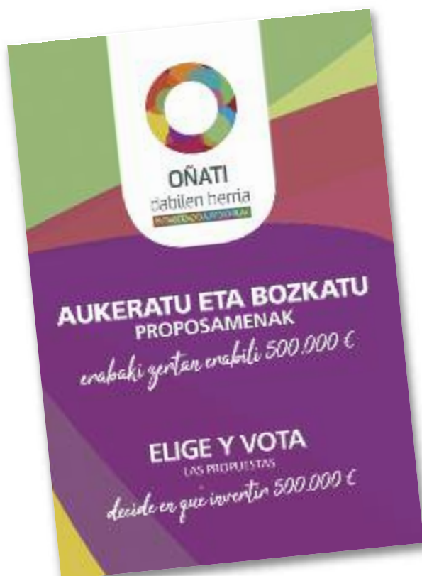
Aldizkari honekin batera banatu den esku-orrian duzue informazio guztia

(* ) Bertan proposamen guztien xehetasunak ezagutu ahal izango dira