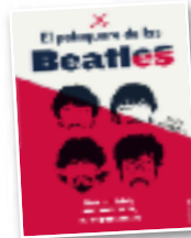
Biografia "El peluquero de los Beatles"