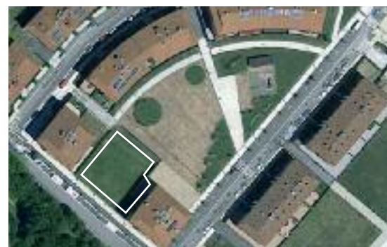
Goiko plazan ere berdegunea handituko da , gaur egun dauden bi borobil berdeak elkartuz.