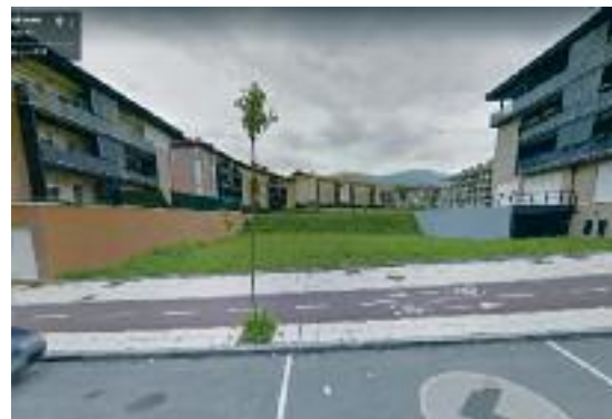
San Martin auzuko 18 eta 20 zenbakidun etxe-blokeen artean egokitzeko da jolasgunea